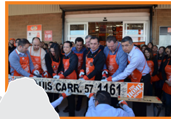
S. L. POTOSÍ, S.L. POTOSÍ