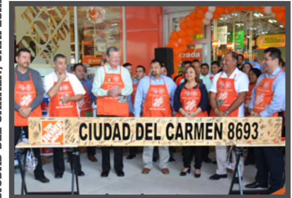
CIUDAD DEL CÁRMEN, CAMPECHE