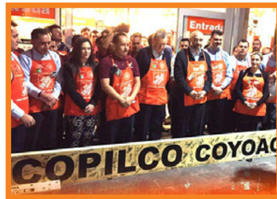
COPILCO, CIUDAD DE MÉXICO